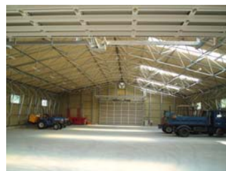
立体トラスの倉庫